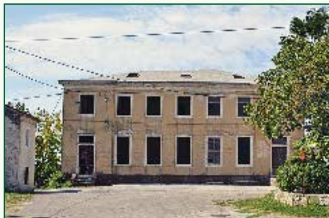
▼ Školska zgrada u Novoj Vasi