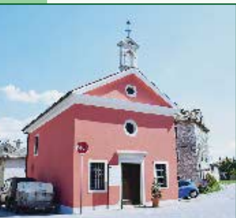
▼ Crkva Svetoga Roka