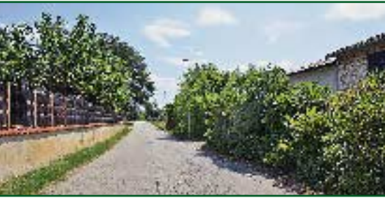
▼ Cesta Brtonigla – Nova Vas

U staru obnovu krova školske u Novoj Vasi predviđeno je 200.000 kuna (bez PDV-a), a u planu je granja i dječjeg igrališta u tom naselju.