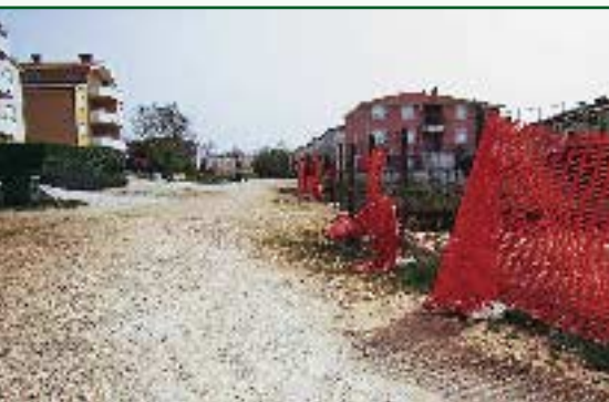
▼ Nova cesta u Karigadoru