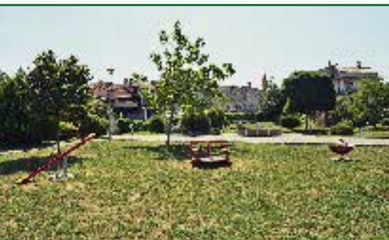
▼ Park u Brtonigli