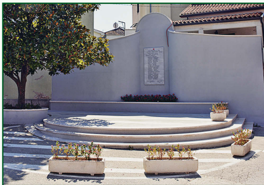
▼ Spomenik na Trgu Mazzini

U ukupnim radovima posebno do izražaja dolazi i izgradnja glavne mjesne ulice u naselju Karigador. Uz to, nastavlja se izgradnja prometne mreže ulica kroz stambene dijelove naselja i parkirališta sa pratećom infrastrukturom.