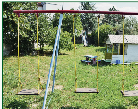
▼ Park u Novoj Vasi