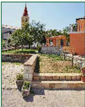
▼ Stepenište i sjenica u Brtonigli