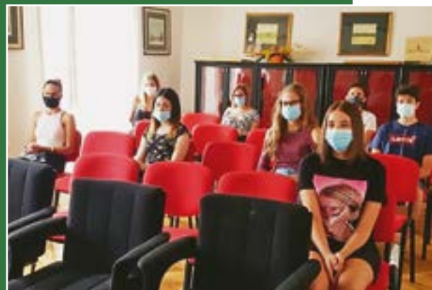
Dio nagrađenih učenika