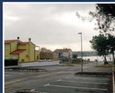
Parkiralište - Karigador