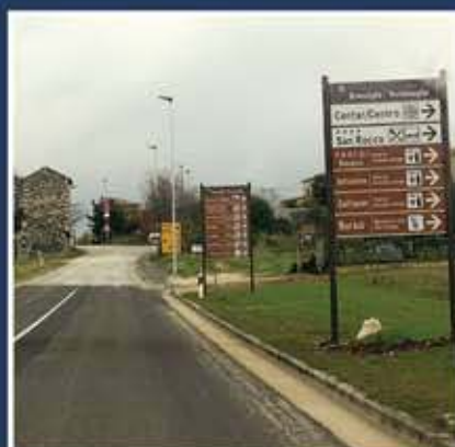
Nova cestovna signalizacija - Brtonigla