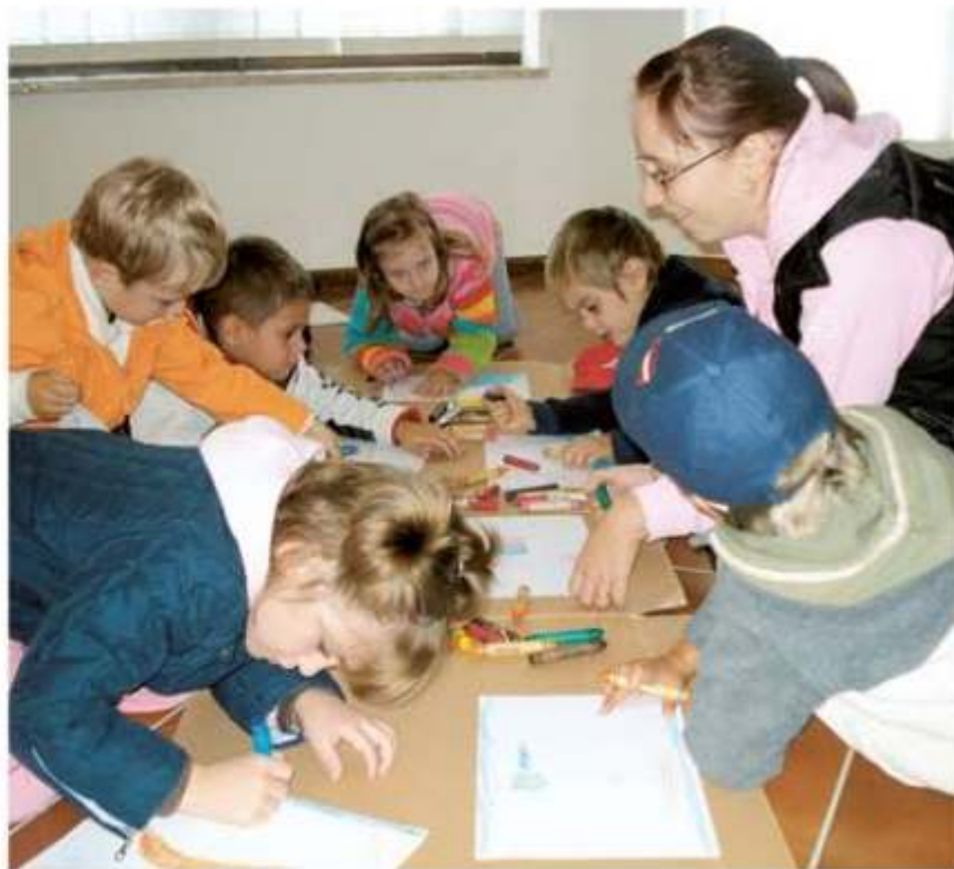
Djeca pastelnim bojama crtaju na podu galerije