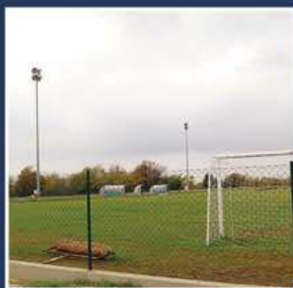
Završeni radovi na igralištu - Nova Vas