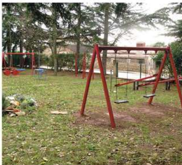
Novo igračke za djecu ispred vrtića - Karigador