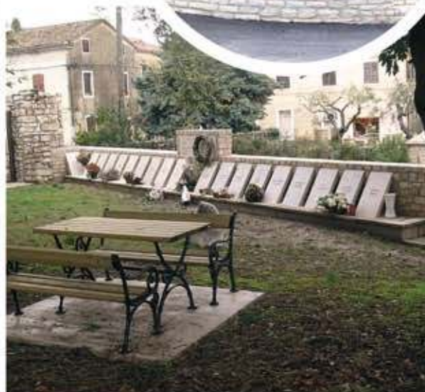
Spomen park - Nova Vas