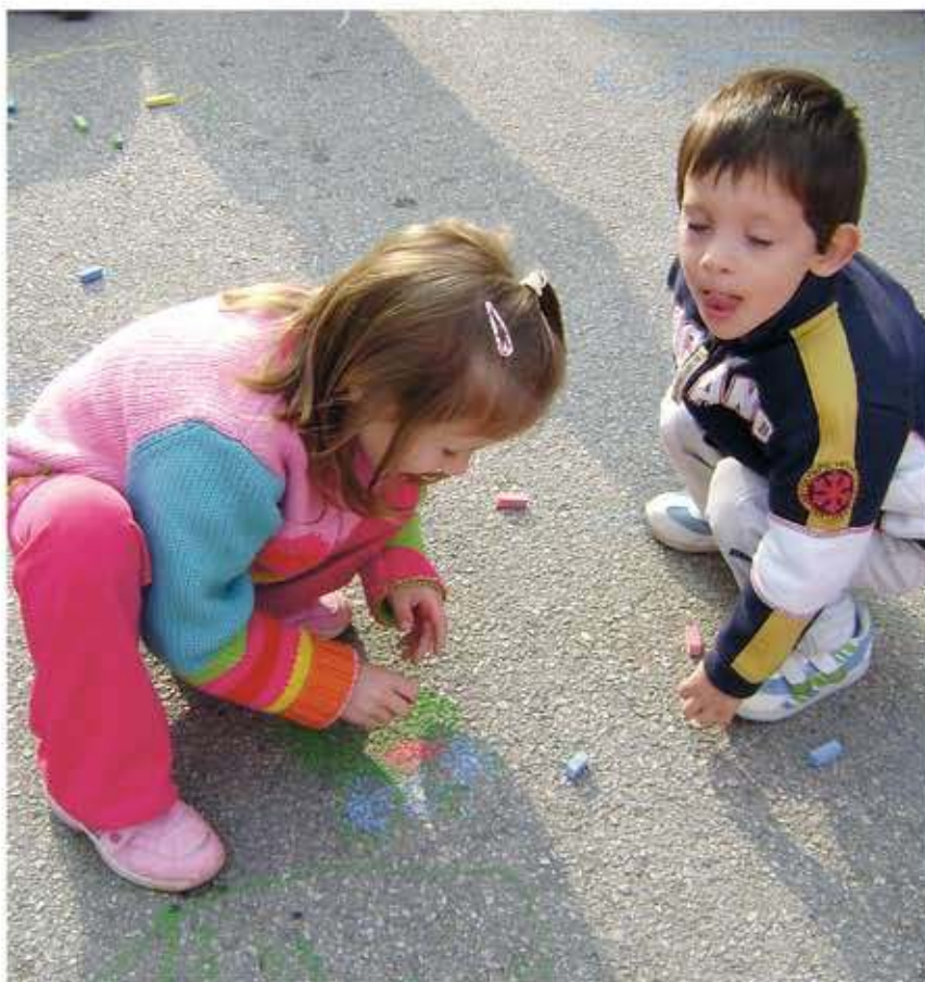
Jedan od ciljeva Dječjeg tjedna bile su «Poruke djece odraslima» kroz izradu plakata i crtanje po pločnicima

Organizirane su aktivnosti sportskog, izražajno kreativnog i zabavnog karaktera, a to su: «Poruke djece odraslima» kroz izradu plakata i crtanja po pločnicima, posjeta pošti, bicikljada za vrtićku djecu, igre bez granica na nogometnom igralištu - za školsku djecu te susret s djecom iz vrtića Talijanske OŠ Novigrad u Novigradu. Osim toga, djeca su mogla uživati u lutkarskim predstavama Kazališta iz Splita u Zajednici Talijana Brtonigla. U sklopu Dana zahvalnosti za plodove Zemlje osmislili smo prodajnu izložbu kruha u suradnji s roditeljima, sponzorima i našim dobavljačima (prodajna mjesta: park uz crkvu Sv. Zenona i malonogometno igralište u Karigadoru), priprema idejnog rješenja dječje pješačke staze u suradnji s P.P. Zenon, uzvratni susret sa djecom talijanskog vrtića iz Novigrada - u šumi u Karigadoru tražit ćemo tetu Jesen. Udruga „