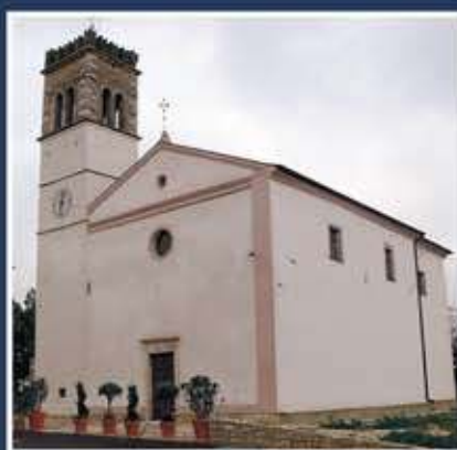
Obnovljena fasada crkve - Nova Vas

Sredinom godine govorena je rekonstrukcija županijske ceste iz Serbana do doline Mirne s izvedbom asfaltnog zastora i uređenjem oborinske odvodnje u dužini cca 1400 m 3 . Utrošen je iznos od 670.000,00 kn + PDV. Radovi su dovršeni krajem mjeseca rujna. U izradi je analiza troškova za asfaltiranje ceste prema naselju Grobice iz Brtonigle i prema naselju Fjorini od križanja na cesti Novigrad - Brtonigla do ulaska u naselje Fjorini.