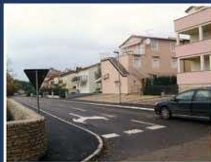
Asfaltiranje ceste - Karigador