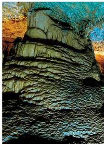
Špilja Mramornica - otkrivena ljepotica

Mjesec kolovoz je, kao i svake godine, najintenzivniji mjesec u godini što se tiče događaja. Prve važnije kolovoške manifestacije bile su uspješne „Večeri Karigadora“ koje su se održale 2. i 3. kolovoza u Karigadoru, u sklopu kojih je bilo pregršt zbivanja za sve uzraste: od dječjih likovnih radionica i vožnje biciklom, do turnira u briškoli i trešeteu, malog nogometa, glazbenih večernjih zabava i kulturno umjetničkih nastupa te bogata ponuda ribljih specijaliteta. Ove je godine fešta bila jako posjećena od strane turista.