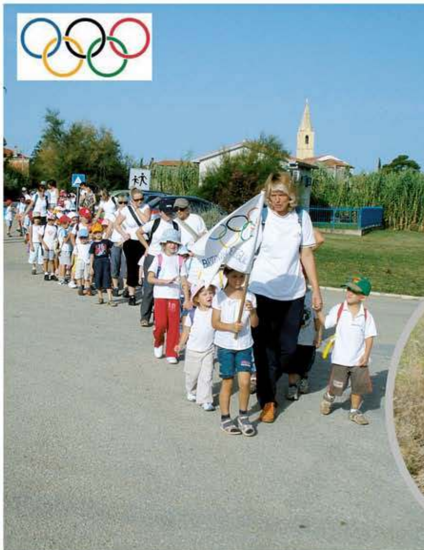
Sudjelovalo je oko osamdeset učesnika, a najmlađi je imao tek dvije i pol godine

organiziranjem aktivnosti koje traju najmanje 30 minuta, a poveznica je bijela majica koju nose svi učesnici aktivnosti. Naša je ustanova, zajedno sa HOŠ i TOŠ Buje područna škola Brtonigla organizirala pješački pohod "BRTONIGLA - M. MARZARI-BRACANIJA- KRŠIN- BRTONIGLA" U pohodu su učestvovali vrtičke skupine: Pčelice, Ribice, Orsetti, te učenici talijanske i hrvatske osnovne škole Brtonigla sa svojim odgojiteljicama, učiteljicama, medicinskom sestrom i trenerom. Sudjelovalo je oko 80 učesnika, a najmlađi je imao tek dvije i pol godine. Nakon duge šetnje odmorili smo se ispod ogromnih hrastova u Bracaniji (to vrijedi osjetiti i doživjeti!). Odmorni, još smo se malo spustili nizbrdo, pa opet popeli uzbrdo i stigli na ukusan ručak u "Verbaldu". Ponosni smo na ovaj naš pothvat jer znamo da to neće biti posljednji.