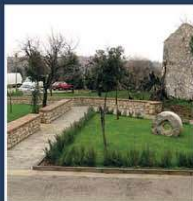
Park prolaz - crkva Sv. Zenona Brtonigla