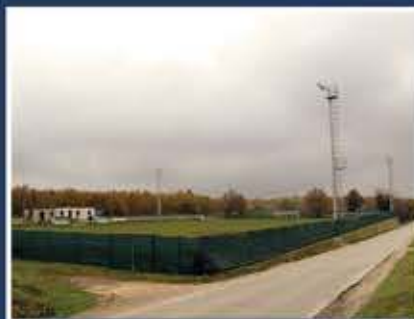
Nova rasvjeta na igralištu - Brtonigla