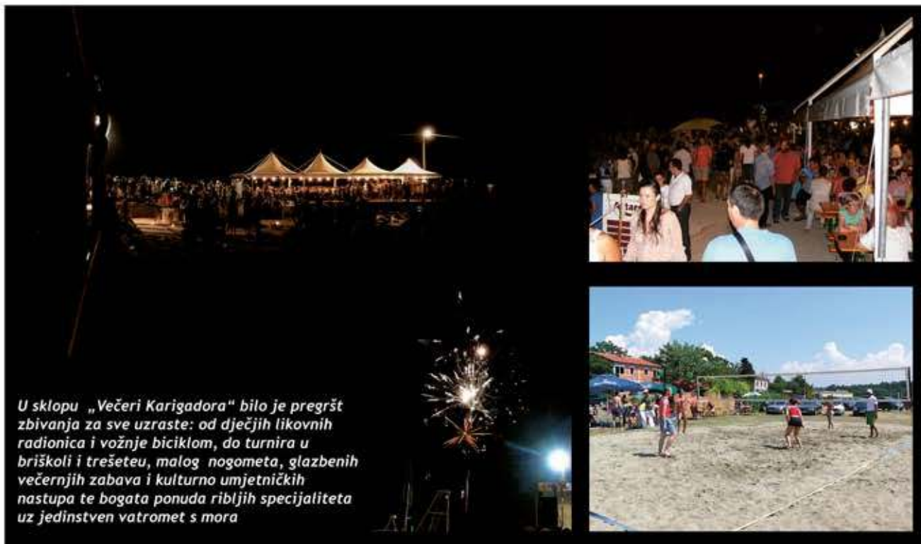
U sklopu „Večeri Karigadora“ bilo je pregršt zbivanja za sve uzraste: od dječjih likovnih radionica i vožnje biciklom, do turnira u briškoli i trešeteu, malog nogometa, glazbenih večernjih zabava i kulturno umjetničkih nastupa te bogata ponuda ribljih specijaliteta uz jedinstven vatromet s mora