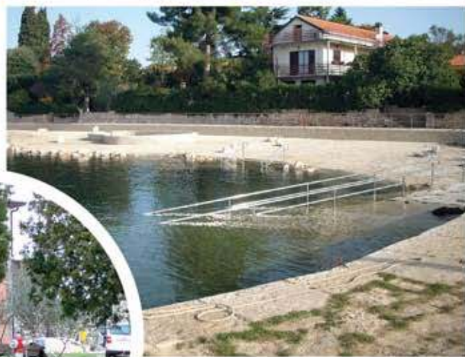
Uređena plaža kod glavnog mola - Karigador; mali park u kružnom toku - Nova Vas (u krugu)

U ovoj godini dovršena je treća faza uređenja glavnog parka u Brtonigli u kojoj je bilo predviđeno opločenje, navodnjavanje, hortikultura, izvedba fontane te postava igračaka za djecu. Utrošeno je cca 350.000,00 kn + PDV i radovi su izvedeni do sredine ljeta. Planira se postava bravarije s izradom ulaznih kapija i finišeiranje bazena fontane. Uređena je prilazna staza parkiralištu kod restorana Primizia te su uređene zelene površine uz stazu sa postavom navodnjavanja. Utrošeno je cca 120.000,00 kn + PDV. Planira se nastavak uređenja parka do crkve Sv. Zenona. Rekonstruirana je stara špina na južnom dijelu naselja Brtonigla, pritom je uređen obodni potporni zid špine i eliminirani šahtovi vodovoda s izradom novoga u nivou terena. Utrošeno je cca 45.000,00 kn + PDV. U dovršetku je rekonstrukcija stare špine na ulazu u naselje Pavići s uređenjem okolne površine. Planira se daljnja rekonstrukcija špine u Fernetićima i Balbijama. Prije početka turističke sezone uređena je plaža kod glavnog mola u Karigadoru. Utrošeno je cca 800.000,00 kn + PDV a pritom su izvedeni radovi opločenja kamenom, izvedene prilazne rampe za osobe s invaliditetom i rampa za spuštanje čamaca u more te pješčanik za djecu. U daljnjem planu je opločenje dijela plaže prema Ladinom Gaju. Ova investicija, kao i daljnje uređenje plaže u Karigadoru, značajno pridonosi razvoju turističke ponude.