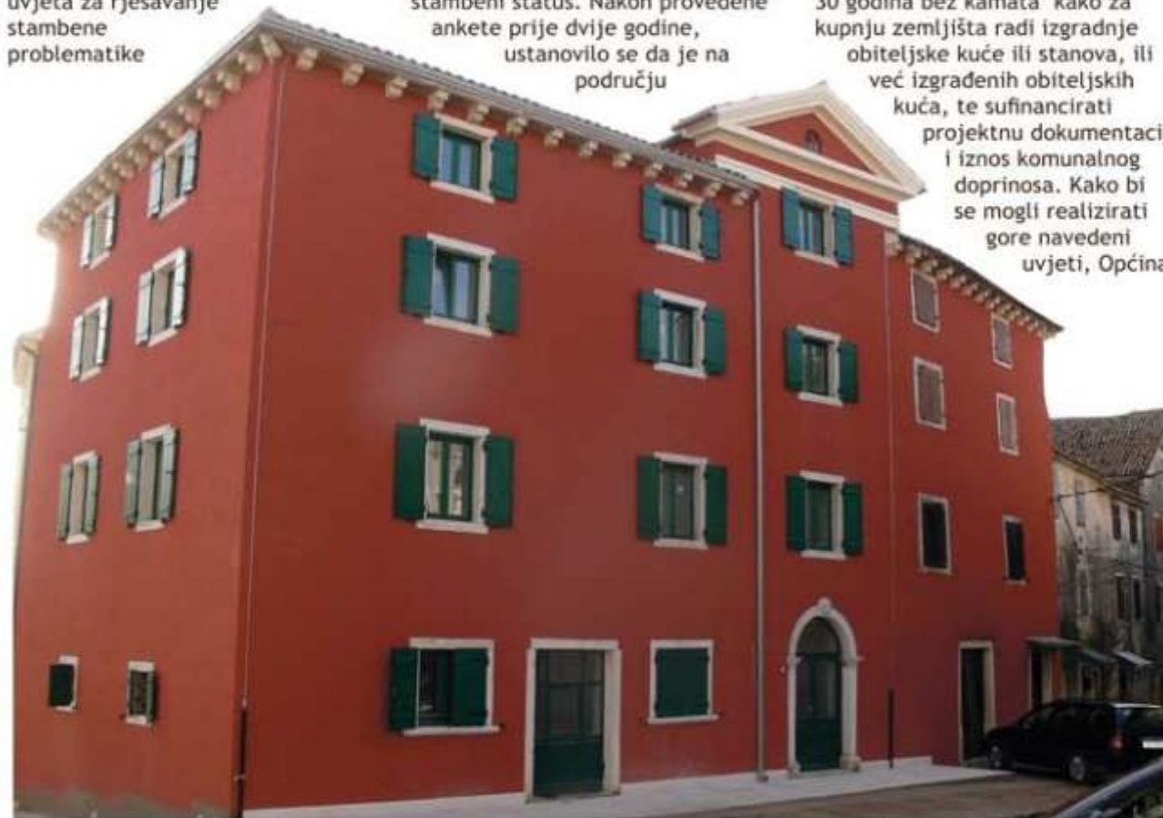
Prodana su tri od pet stana koji se nalaze u obnovljenoj zgradi gdje će biti smještene liječnička ambulanta i stomatološka ordinacija

Brtonigla je dana 31. listopada potpisala sa Erste & Steiermarkische bankom Ugovor o poslovnoj suradnji kojim će se omogućiti sufinanciranje dijela kamatne stope stambenih kredita svim fizičkim osobama sa prebivalištem na području Općine Brtonigla koje su sklopile Ugovor o stambenom kreditu za otkup stambenog objekta ili zemljišta za izgradnju obiteljske kuće na području Općine Brtonigla radi rješavanja stambenog pitanja. U sklopu takvog programa 6. rujna sklopljeno je prvih šest ugovora te je 4. studenog ponovno raspisan Natječaj za prikupljanje zahtjeva za kupnju stanova, neizgrađenog građevinskog zemljišta za gradnju obiteljskih kuća i izgrađenih obiteljskih kuća u sklopu realizacije Programa zadovoljavanja stambenih potreba građana Općine Brtonigla po povoljnijim uvjetima, program kojim će se nastaviti rekonstrukcija stare škole u Brtonigli gdje će se urediti još četiri stana za prodaju. Ugovorima koji su potpisani 6. rujna prodana su tri od pet stana koji se nalaze u obnovljenoj zgradi u centru naselja gdje će biti smještene liječnička ambulanta i stomatološka ordinacija. Osim kupnje tih stanova, prodane su i dvije stare kuće te građevinsko zemljište u Radinima. Na novom su natječaju, osim preostala 2 stana koja se nalaze u zgradi buduće ambulante, još tri nekretnine kojima će se zadovoljiti stambene potrebe naših građana.