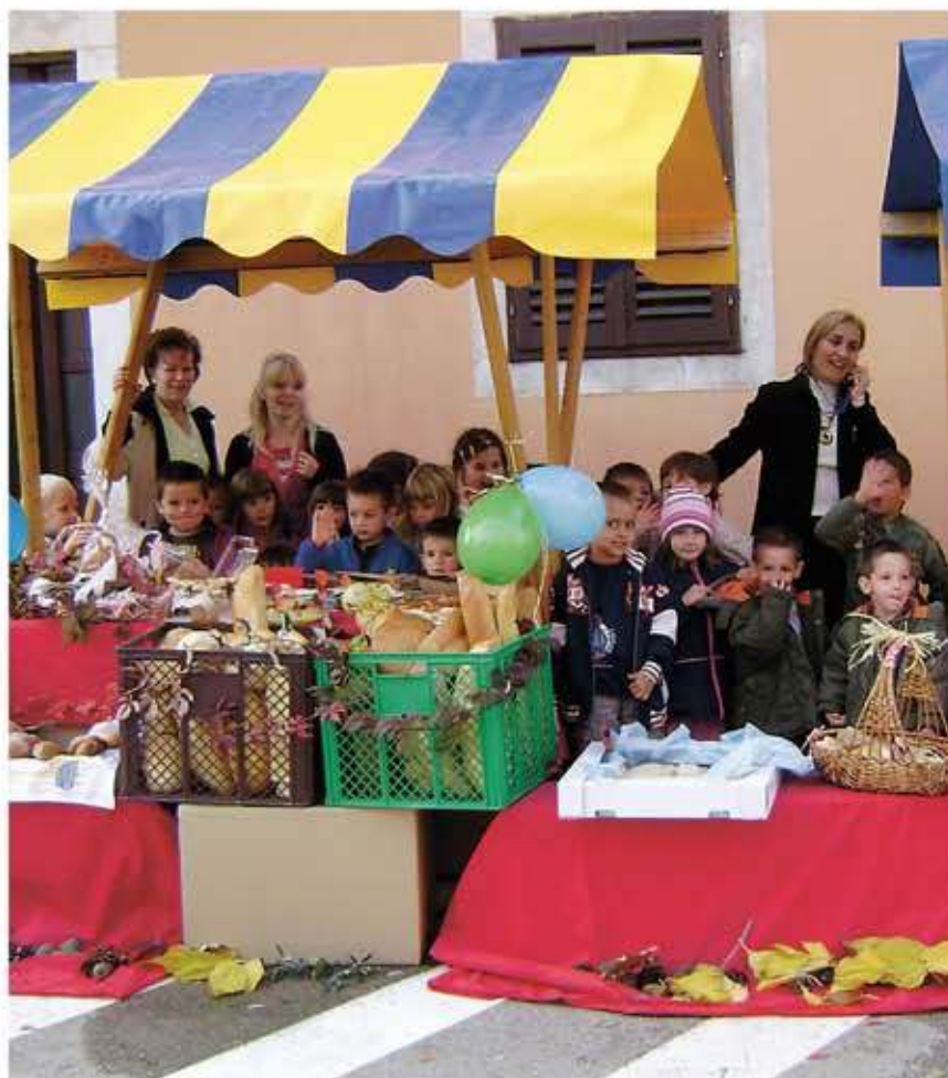
U uspješnoj prodaji kruha sudjelovalo je ukupno 50 djece

DJEČJI VRTIĆ KALIMERO - SCUOLA D' INFANZIA CALIMERO