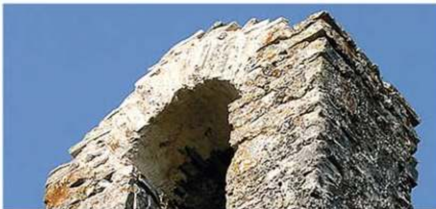
L'epoca veneziana rappresenta un significato fondamentale per il nostro comune

L'idea di indagare la storia veneziana nasce anche da una constatazione di fondo: che la storiografia istriana si limita spesso a trattare i centri maggiori lasciando in ombra, salvo rare eccezioni, la conoscenza delle località minori ritenute, a torto, meno interessanti. È questo il caso di Verteneglio, la cui storia è stata tratteggiata sinora in un paio di volumi le cui tematiche, a parte qualche breve riferimento, esulano dal contesto veneziano che s' intende approfondire.