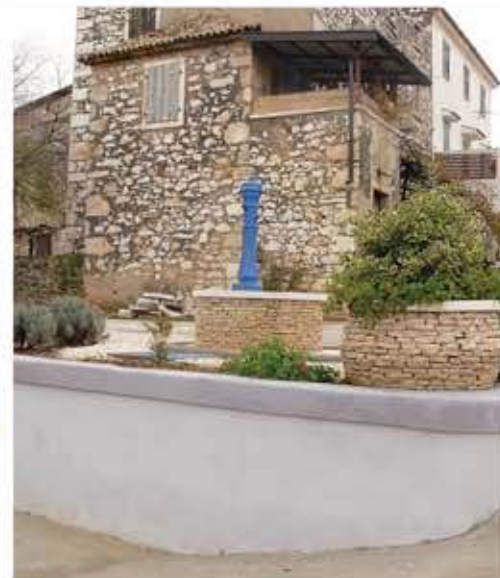
Fontana - Brtonigla