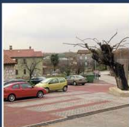
Parkiralište - Brtonigla