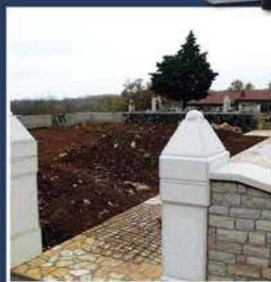
Izgradnja novog groblja - Serbani