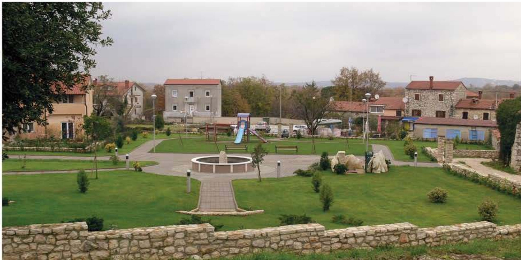
Glavni park - Brtonigla

Realizacija usklađena s planovima i zacrtanim rokovima