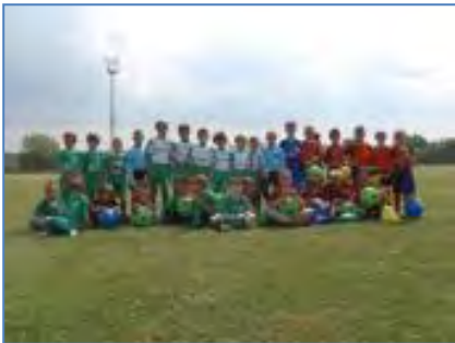
Podupire se rad Predtakmičara N.K. Brtonigla-Nova Vas.

Po provedenom postupku jednostavne nabave, dana 31. srpnja 2020. godine, sa ovlaštenim je poduzećem KAPITEL d.o.o., sa sjedištem u Žminju, 9. rujna 6, sklopljen Ugovor za izvođenje konzervatorsko-restauratorskih radova i rekonstrukcije kulturnog dobra Kaštel Sv. Jurja (Castel S. Giorgio, Santi Quaranta). Ugovorom je obuhvaćeno izvođenje II. faze radova sanacije romaničke crkve u sklopu kulturnog dobra Kaštel Sv. Jurja, a sve prema opisu iz troškovnika za kojeg je izdano prethodno odobrenje Ministarstva kulture RH, Uprave za zaštitu kulturne baštine, Konzervatorskog odjela u Puli. Radovi sanacije su pri kraju te je Ministarstvu kulture RH, putem Poziva za predlaganje programa javnih potreba u kulturi Republike Hrvatske za 2021. godinu, upućen zahtjev za sufinanciranje III. faze radova.