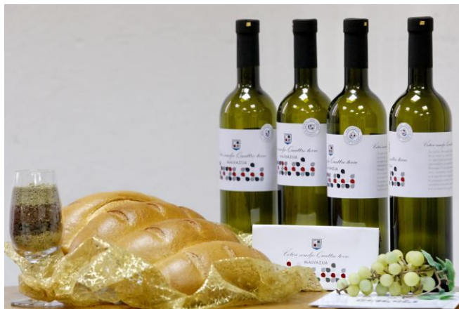
Slike: Kruh Bobozzi di Verteneglio i Štruca di Verteneglio.

Razvojna Agencija Brtonigla d.o.o. – Agenzia per lo Sviluppo Verteneglio s.r.l.